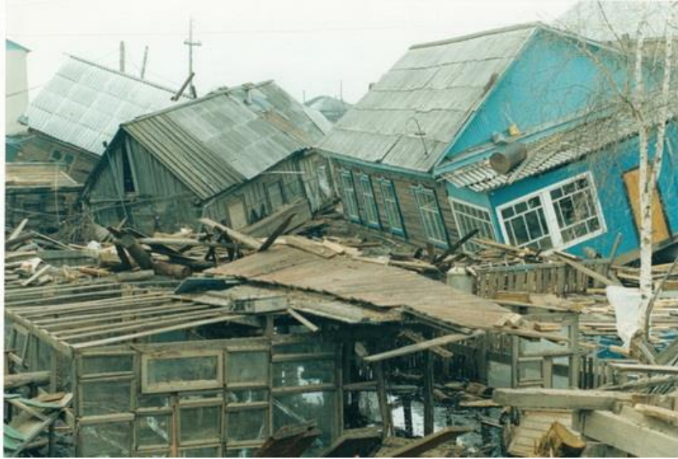
После потопа – как после погрома

Страшная картина предстала взору ленчан: река скovyрнула, стащила с места, опрокинула, смяла, разодрала на части тысячи домов, бань, сараев, теплиц; загромодила постройками улицы Ленина, Чапаева, Заозёрную; сорвала с переулка Мухтуйский больше десятка домов и «прописала» их аж по Пеледуйской трассе! Устроила кладбище домов на перекрёстке улиц Ленина – Каландарашвили, сюда же, словно девятым валом, перенесла измочаленный «Девятый» магазин; опустошила значительный участок Набережной от церкви до Мухтуйки. Горе тяжким грузом навалилось на плечи людей. Это был второй шок.