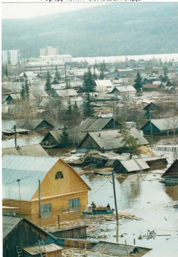
Город топят большая вода

Когда вода пошла на снижение, радости было много. Первый шок мы пережили. После стольких часов водяного плена хотелось поскорее выбежать наружу, узнать, как там город? Многие улочки и кварталы в низменных местах были еще под водой, когда горожане с мрачными, подавленными, потемневшими от копоти костров лицами, разинув рты, охая и ахая, ходили по разгромленному Ленску и не узнавали его.