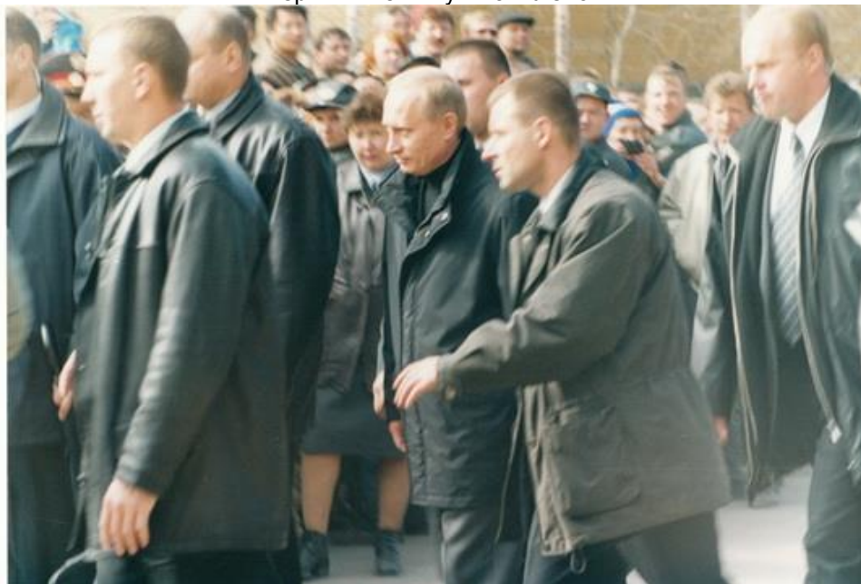
Первый визит Путина в Ленск

Ленск достаточно сильно пострадал от реки в 1998 году, но, к сожалению, на первую трагедию и Россия, и Якутия прореагировали вяло. Проблемы, порожденные той бедой, Ленск так и не сумел разрешить в полном объеме, десятки пострадавших ленчан продолжали ютиться в детских садах, общежитиях и гостиницах, не имея собственной крыши над головой. Под воду ушел весь частный сектор, а это более чем четыре пятых всего города. Плавали даже деревянные двухэтажки.