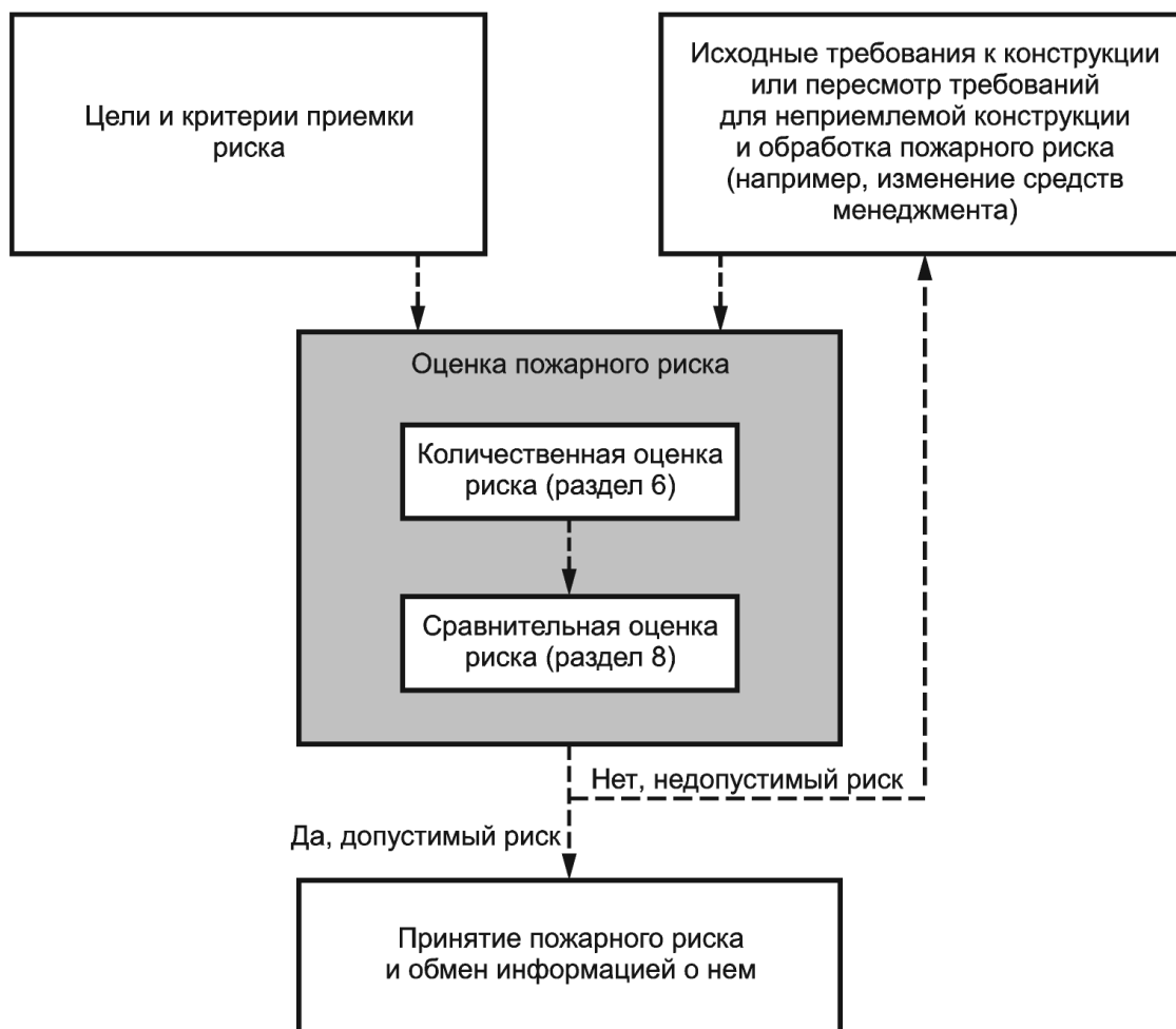
Рисунок 1. Схема менеджмента пожарного риска

Оценка пожарного риска начинается с анализа установленных целей и предложенных требований к конструкции или другой части структуры окружающей среды исследуемого объекта защиты. Вначале проводят количественную оценку риска, связанного с требованиями к объекту защиты, и затем проводят его сравнительную оценку. Сравнительная оценка риска состоит из сравнения предполагаемого риска с критериями допустимости риска. Если предполагаемый риск является недопустимым, то необходимо внести соответствующие изменения в объект защиты или изменить требования к нему и/или провести обработку риска и затем провести повторную оценку риска. Если в результате сравнительной оценки риск признан допустимым, то должен быть описан остаточный риск. При этом обязательно формальное принятие риска и обмен информацией о риске с причастными сторонами.